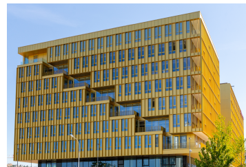
Nice (06) - Bd René Cassin

La distribution potentielle 2025 est anticipée stable par rapport à 2024, soit un taux de distribution prévisionnel avant fiscalité de 5,27% sur la base du prix d'acquisition en vigueur.